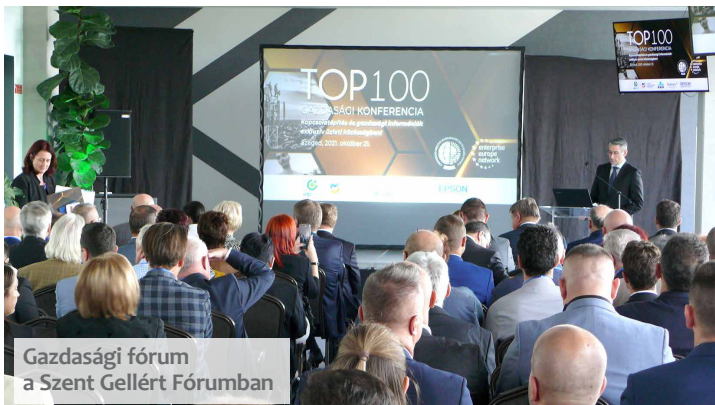
Gazdasági fórum a Szent Gellért Fórumban

– Különös helyzet alakult ki itt, a pandémia árnyékában, hiszen míg az egyik oldalon soha nem látott pályázati lehetőségek nyíltak meg a vállalkozások előtt, ugyanakkor januártól a megemelt minimálbérrel, illetve garantált bérminimummal és persze annak minden továbbgyűrűző hatásával is szembe kell nézniük. Menni fog? ➤