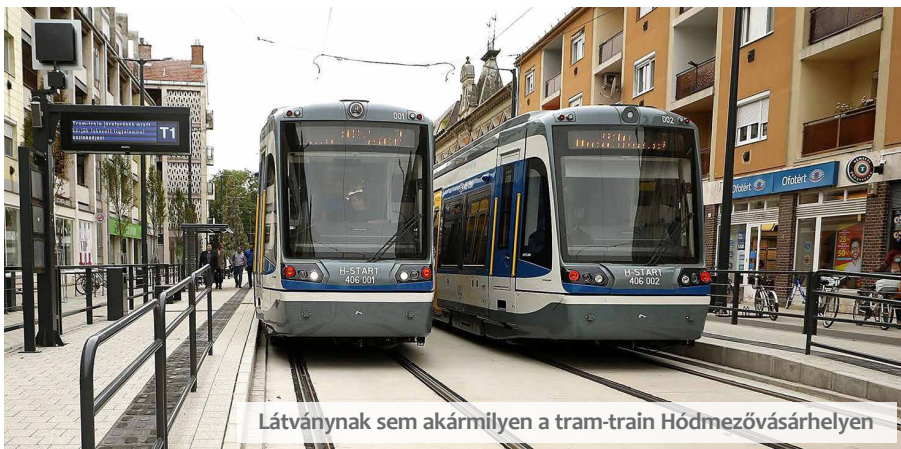
Látványnak sem akármilyen a tram-train Hódmezővásárhelyen

nálata? Végül is mi lehet a jövő? – az önzvezető autó, vagy repülő vagy valami más, például a hidrogénhajtás lesz az alternatíva, ám ez is csak akkor előremutató, ha zöld energiával állítjuk elő (vagyis a jövő talán a zöld hidrogén lehet). És hol van ebben a MOL 20 év múlva? Talán abból lehet messzemenő következtetés levonni, hogy a nagyvállalatnál dekarbonizációs és petrokémiai fókuszba került a fogyasztói szegmens minden része – jelentette ki a nagyvállalat értékesítési igazgatója.