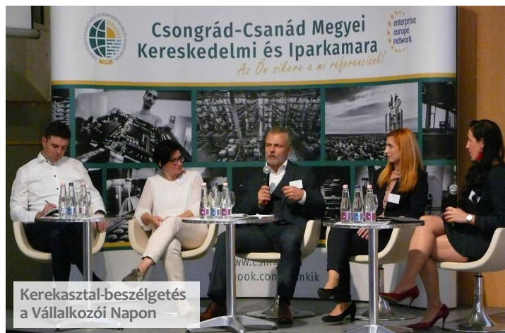
Kerekasztal-beszélgetés a Vállalkozói Napon

– A kamara rendszeresen tolmácsolja a gazdasági szereplők igényeit a szakképzés szervezőinek. Elmondjuk, mit várnak el a szakképzéstől a munkáltatók. A hogyanba természetesen nem szólnunk bele, hiszen az az iskolák dolga, ők értenek hozzá. Régóta mondjuk viszont, hogy alapvető kompetenciákat kellene tanítani akár középfokon, akár