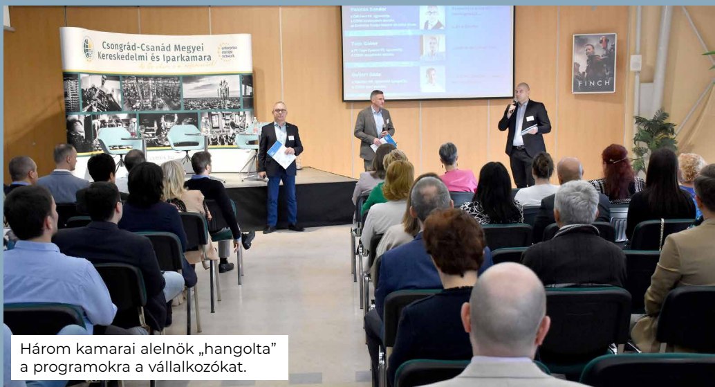
Három kamarai alelnök „hangolta” a programokra a vállalkozókat.

Az esemény az Európai Bizottság és a Miniszterelnökség támogatásával valósult meg.