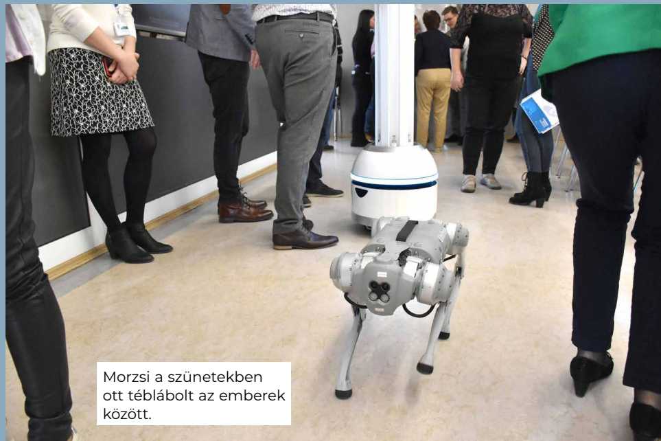
Morcsi a szünetekben ott téblábolt az emberek között.

botpincérekre. A humanoid robotok világában azonban van egy határ, amit nem tanácsos átlépni, ugyanis, ahogy egyre jobban elkezdnek hasonlítani ránk, és egyre élethűbben utánoznak minket, esetleg már érzelmeket is közvetítenek, beszélnek hozzánk, annál ijesztőbbnek és félelmetesebbnek érezzük őket. Ezt