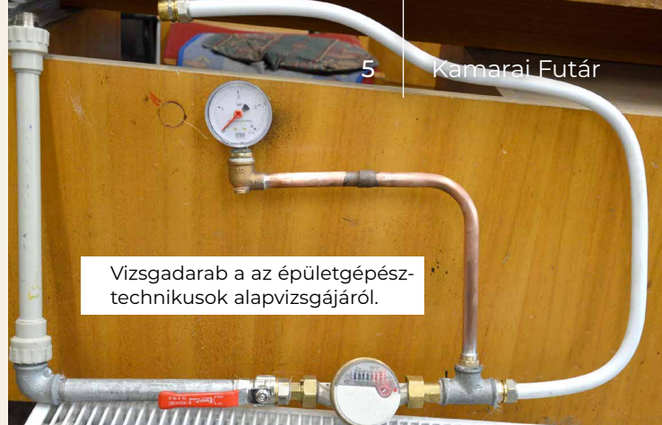
Vizsgadarab a az épületgépész-technikusok alapvizsgájáról.