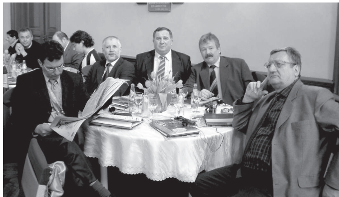
A Csongrád Megyei Kereskedelmi és Iparkamara delegációjának egy csoportja

A „Kárpátia” Magyar–román Kereskedelmi és Iparkamara és az Udvarhelyszéki Kis- és Középvállalkozások Szövetsége február 9-én „A Kárpát-medence gazdasági lehetőségei Románia EU-csatlakozása után” címmel gazdasági fórumot rendezett Székelyudvarhelyen.