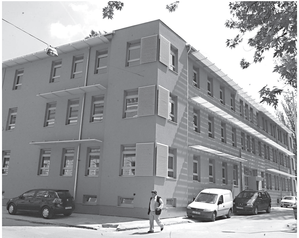
Neurobiológiai tudásközpont – kutatóhely és inkubátorház egyszerre

Az együttműködésre ösztönöz az is, hogy saját otthonra lelt a