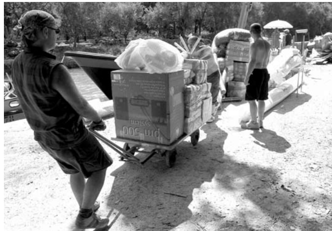
Velünk élő csomagolóanyagok

A Magyar Kereskedelmi és Iparkamara a Környezetvédelmi és Vízügyi Minisztérium munkabizottságával, szakmai képviselőkkel, önkormányzatokkal és civil szervezetekkel együttműködve egy új termékdíj (vagy ökoadó) törvény kidolgozását tűzte ki célul, melynek egyik legfontosabb prioritása a hulladékok minél nagyobb arányú újrahasznosítása, az EU előírásainak való maradéktalan megfelelés, illetve az általános versenyképesség növelése, aminek egyik alapvető eleme az adminisztráció csökkentése.