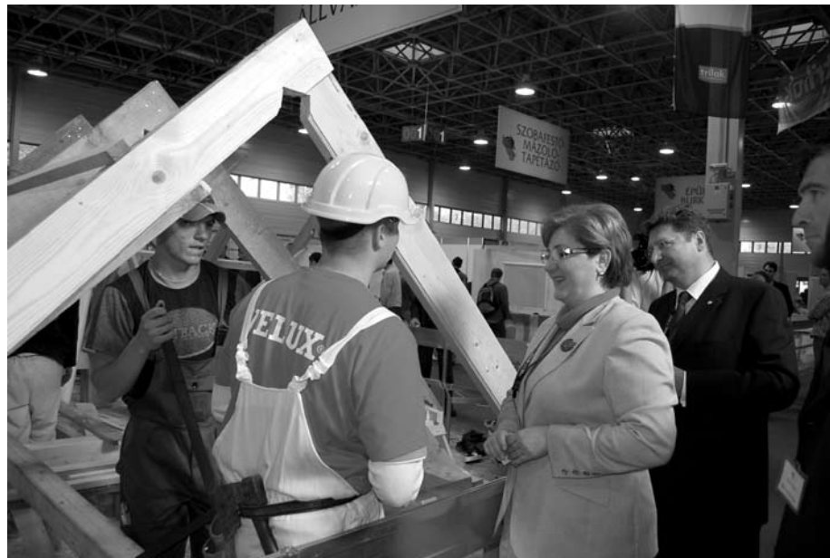
Az építőipar kiemelt figyelmet kapott az MKIK által rendezett Szakma Sztár Fesztiválon is

válságból válságba bukdacsolni, akkor azonnal lépni kell. Csak így lehet, megteremteni a tartós, kiegyensúlyozott gazdasági növekedés feltételeit. Ennek a társadalom által való elfogadtatásához kell minden erőt megmozgatni, igénybe véve a kamara segítségét is.