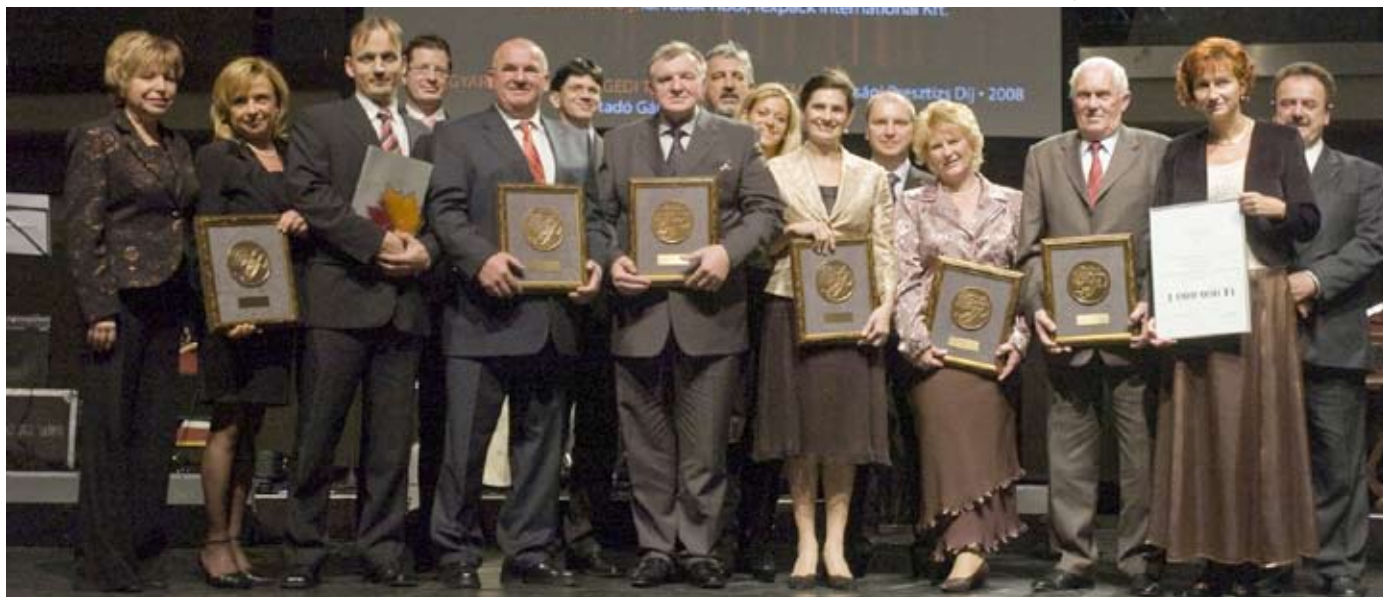
Díjazók és díjazottak