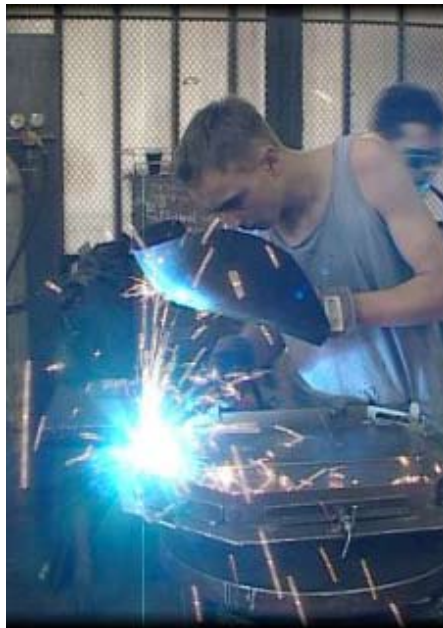
A jó hegesztő kincset ér

A képzések tartalmi és módszertani intézkedései közül igen biztató az ún. modul rendszerű képzés bevezetése. A szakmák oktatását előre meghatározott modulokra osztva, az elméleti és