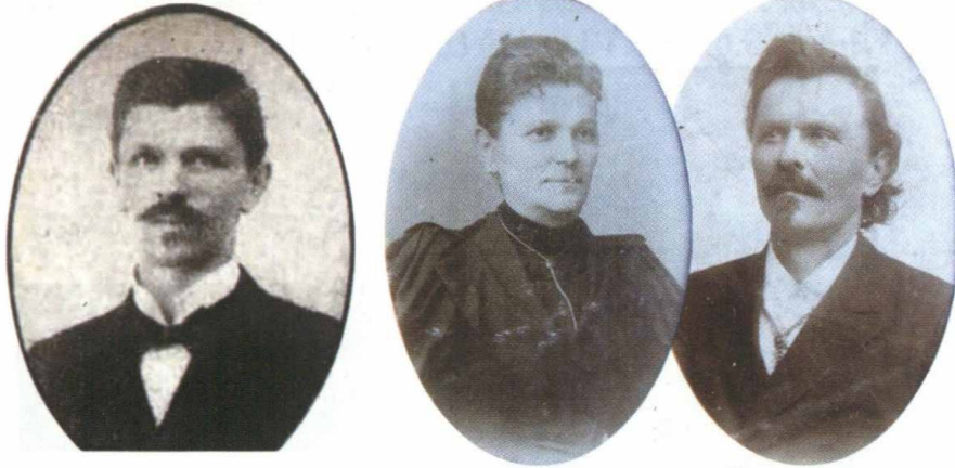
Maróczy Géza ifjúkori arcképe, valamint szülei: Valkovits Róza és Maróczy József

A húsvágó gépet 1867-ben Szegeden is bemutatták, s a találmány „negyedik díjat és „öt franc arany pénzt” hozott a konyhára.”