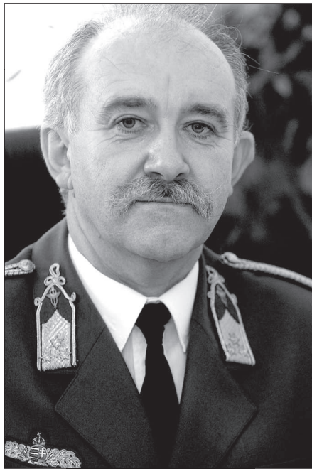
Márkus András dandártábornok

keresztül történő gazdasági vámeljárásokat a gyakorlatba lehetne ültetni. Itt elsősorban az aktív és a passzív feldolgozásra gondolt. Ebből a legegyszerűbbek és legismertebbek talán a bérmunka jellegű ügyletek, amelyek igencsak kombinálhatók különféle módszerekkel az unió belük. A másik pedig a