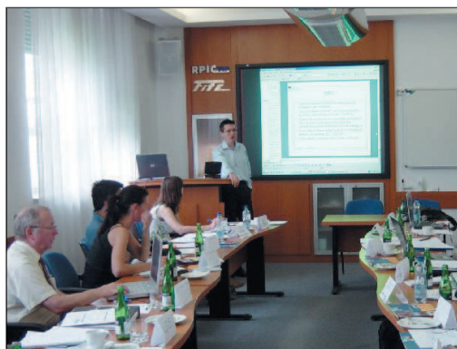
A prezentáció egy részlete, amelyre Osztravában, a Cseh Köztársaságban került sor, 2006. június 22-én.

és Iparkamara a partnerek közül azt a feladatot kapta, hogy az elkészült szoftvert valós körülmények között tesztelje.