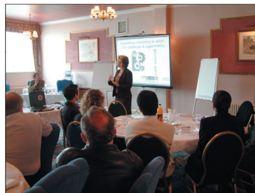
A projektet bemutató konferencia 2006 májusában.

Mivel a szoftver tesztelése versenyhelyzetben lévő vállalkozásoknál történt, igen hasznos információkra tehetünk szert a program továbbfejlesztése érdekében. A megszerzett tapasztalatokat a projekt során következő konferenciáján, Castellonban, Spanyolországban ismertetjük.