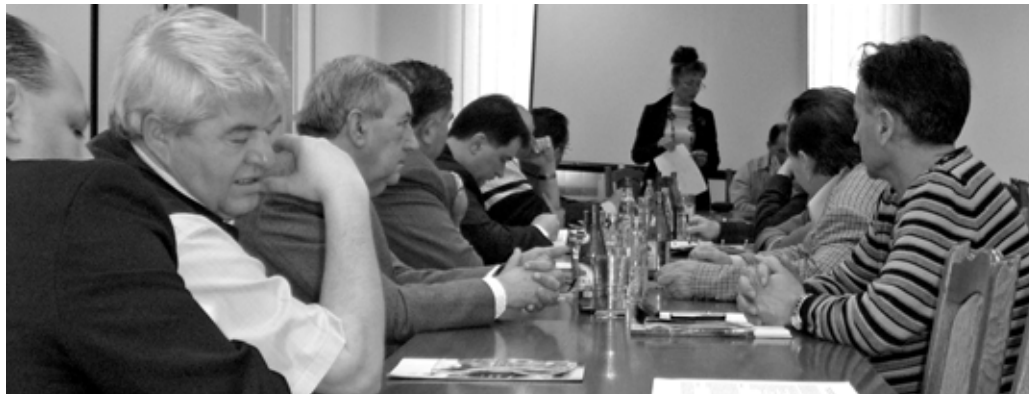
A tagozati ülés résztvevőinek egy csoportja

A húsvéti ünnepeket megelőző témavizsgálatoknál kiemelt figyelmet szentelnek az alábbi árucikkeknek: sonka, kolbász, édesipari termékek, jelölések, megfelelő tárolás.