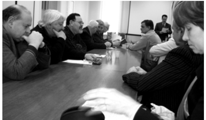
A tagozati ülés résztvevőinek egy csoportja

Lassan nálunk is terjed az a Nyugaton már általános gyakorlat, miszerint inkább kicserélik a kifogásolt terméket, még ha csak fél