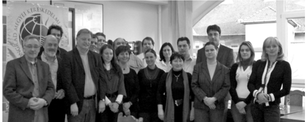
A szegedi partnertalálkozó résztvevői

„A képzés az egyik legfontosabb eszköz az emberi erőforrás-fejlesztésben és megkönnyíti egy fenntarthatóbb világba való átmenetet.” (Agenda 21). A társadalmunk és a munkánk jövőbeli alakulásában a fenntarthatóság elveinek alkalmazása kulcsfontosságú. Ezen elvek alkalmazása a legfontosabb feltétel ahhoz, hogy garantálható legyen a szilárd és tartós fejlődés minden ember számára. A fenntarthatóság elméletében a gazdasági jólét, saját környezetünk védelme és a társadalmi szolidaritás egyaránt cél. A fenntartható fejlődés megköveteli a