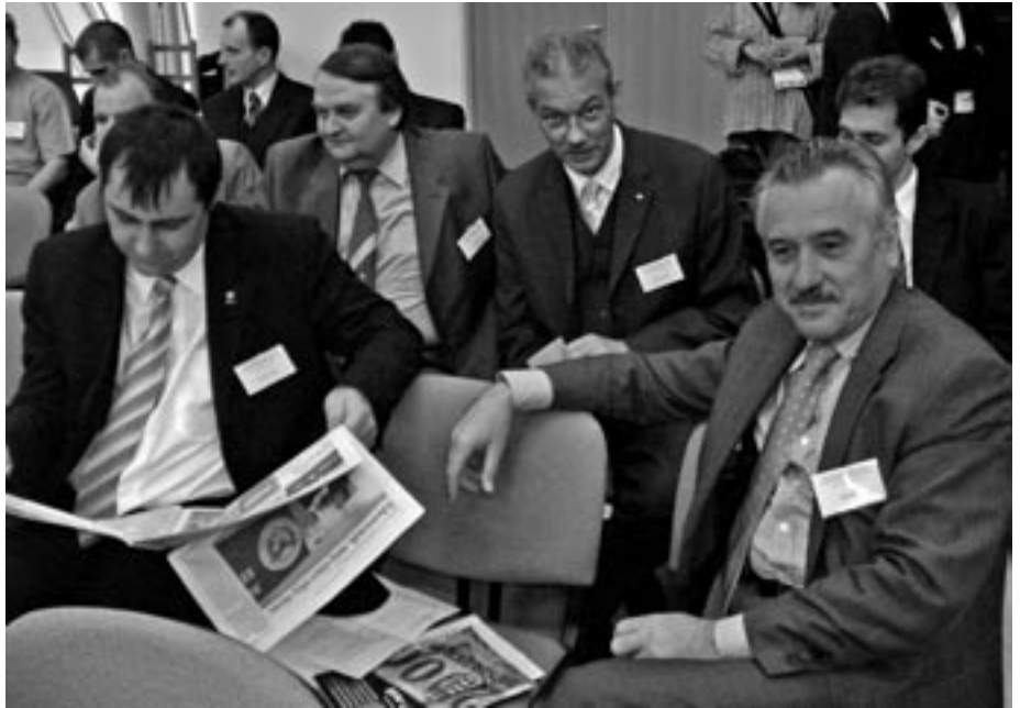
Lazítás a konferencia szünetében...

de ezt elsődlegesen a szolgáltatás színvonalával és nem adminisztratív eszközökkel teszi;