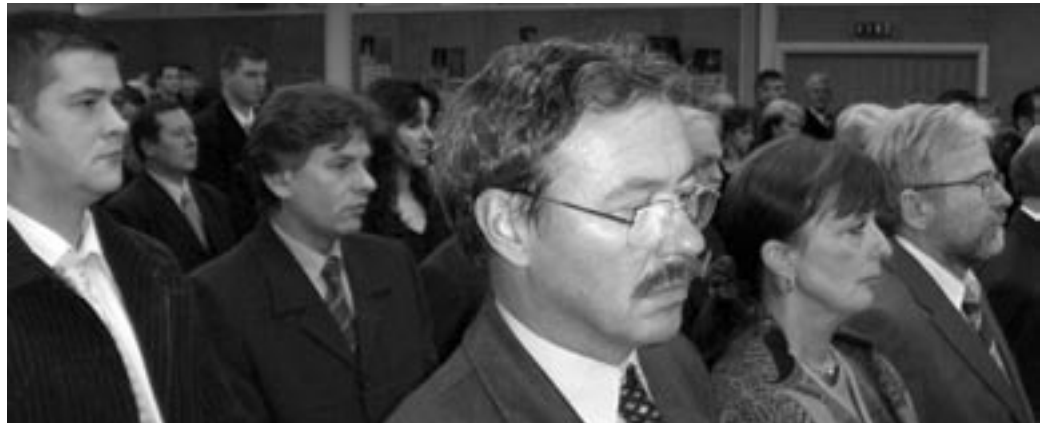
Mesterek és tanítványok – a Himnuszot hallgatják