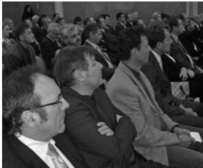
Megtelt érdeklődőkkel a kamara konferenciaterme