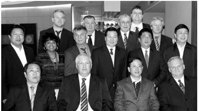
Kínai-magyar családi fotó

Az állam, illetve a tartomány a népesség növekedése, de főként a lakosság életszínvonalának rohamos javulásából következő növekvő élelmiszer-fogyasztás miatt jelentős anyagi erőfőldöz különböző élelmiszer-termelési programok megvalósítására. Hároméves programot indítottak a szarvasmarha-állomány növelésére, aminek keretében jelentős összeggel támogatják az üszőbeállítását. Jelenleg 6000 db éves korú holstein-fríz