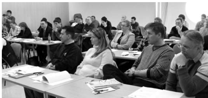
A képzéseket nagy érdeklődés kísérte.

Amennyiben újabb támogatási forrást sikerül szerezni, kama-