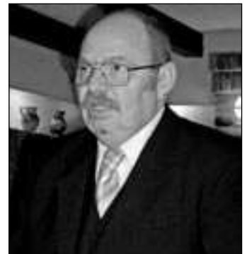
Nagy Ferenc főkonzul.

Vonzó lehet a külföldi befektetők számára, hogy Szerbiában a nyereségadó mértéke mindössze 10%. Alacsonyak a munkabérek is, Szabadkán átlagosan 20-22 ezer dinárt (60-70 ezer forint) keresnek az emberek havonta. A magyar–szerb gazdasági kapcsolatok dinamikusan fejlődnek, a kereskedelmi forgalom tavaly 20%-kal nőtt. Míg a multik időben kapcsolnak, főleg a kereskedelem, a banki szektorban és az ingatlanfejlesztésben megjelentek a nagy befektetők, a termelési típusú kooperációk terén, amihez a leginkább várnák a magyar kis- és közepes vállalkozókat, igen lassú a mozgás. Nagy Ferenc „régimúlt idők dicsőségéről”