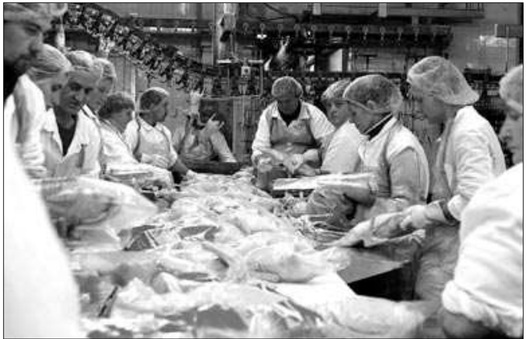
Szigorú biztonsági intézkedések mellett, a megszokott magas színvonalon folyik a termelés a szentesi Hungeritnél.