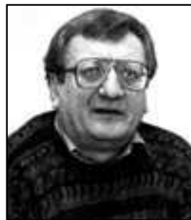
Dr. Tóth István

Nézzük a másik témakört. Hogyan függ össze a versenyképesség és az államháztartás? Lehet-e most egyszeri nagyobb tehercsökkentést végrehajtani? Ismert, hogy Magyarországon a megtermelt nemzeti jövedelem központosított része magas, jóval meghaladja a kívánatos 35-36 százalékot. Magas az adó- és járulékteher, és ez kétségtelenül nem javítja a versenyképességet. A mérték mellett nagyon fontos az elvonások szerkezete is, nem mindegy, hogy forgalmi típusú adó, vagy bérekhez kötődő járulékok formájában vonja el az állam. Egyértelmű, hogy szükség van egy átfogó adóreformra, amely az elvonások mértékének, szerkezetének és az egész adóigazgatás rendszerének megváltoztatását és egyszerűsítését szolgálja. A tehercsökkentésnél kérdés az, hogy