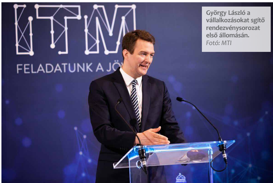
György László a vállalkozásokat segítő rendezvénysorozat első állomásán.

Az államtitkár beszélt arról is, hogy 2021 első negyedében már Magyarországon