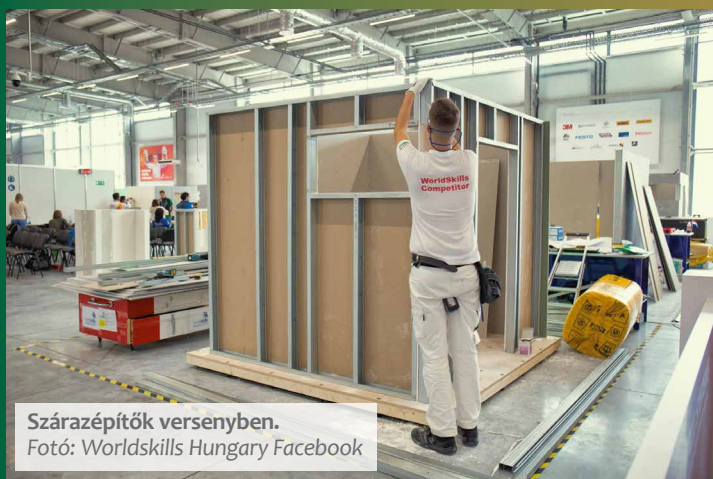
Szárazépítők versenyben.

Az ács versenyfelhívás – melyre 2021. május 30-áig lehet jelentkezni –,