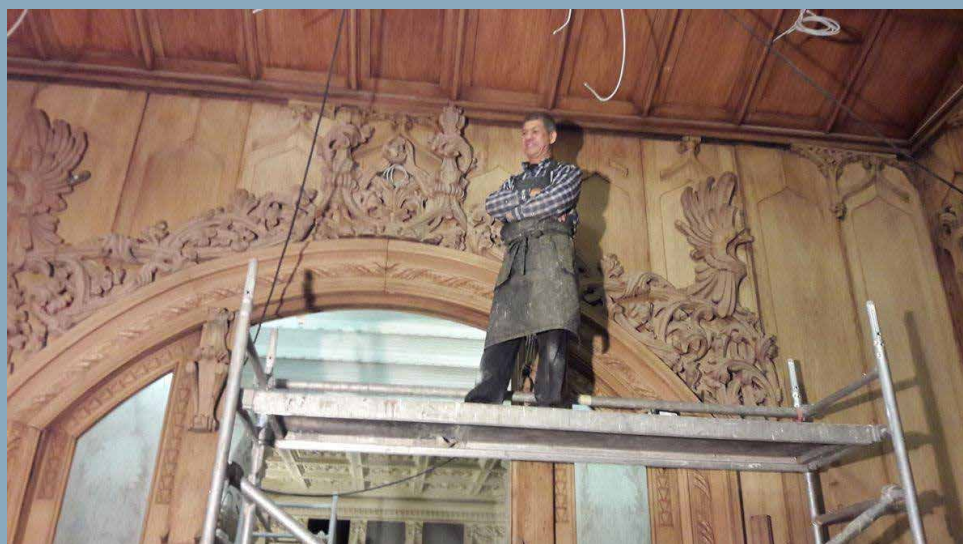
Rostás Árpád munkában.

A szakmai nap kiemelt vendége Rostás Árpád asztalosművész és restaurátor volt, aki nemzetközileg elismert munkásságáról és különleges restauratori projektjeiről mesélt a diákoknak és szakmabelieknek. A híres szakember többek között a Versailles-i kastély, a Louvre, az Országház, valamint a Notre-Dame helyreállítási munkálataiban is részt vett.