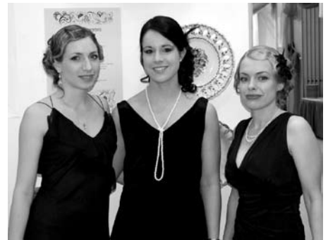
Díszítősor. A kamara fiatal munkatársai kitétek magukért, legszebb formájukban fogadták az est vendégeit.