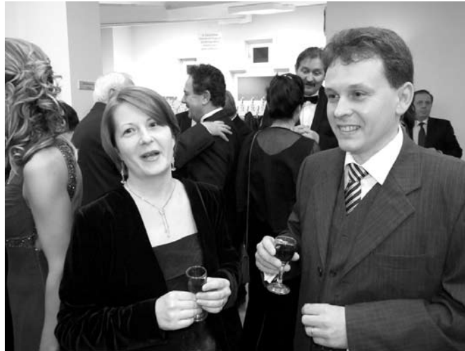
Az Orcsik-féle diópálinkát nem lehetett kihagyni.

A díjátadások után bőséges svédasztalos vacsorával, szórakoztató műsorral, tánccal folytatódott az est. A Memphis Casino rulett- és kártyaasztalainál a szerencsésüket is kipróbálhatták az est vendégei, az öt legeredményesebb játékost ajándécsomaggal jutalmazták a szervezők. Akinek itt nem kedvezett a szerencse, tovább bízhattak Fortunában, hiszen az éjféle tombolasorsoláson – a vállalkozók felajánlásainak köszönhetően –, igen sok értékes ajándéktárgy talált gazdára. Lehetett nyerni például igen értékes kamerás kaputelefont, számítástechnikával kapcsolatos eszközöket, hosszú hétvégi pihenést, finomabbnál finomabb borokat, édességeket, hasznos ajándécsomagokat.