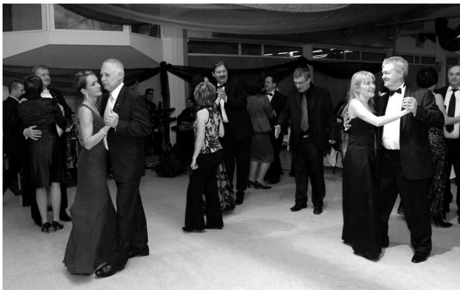
A táncparkett ördögei...