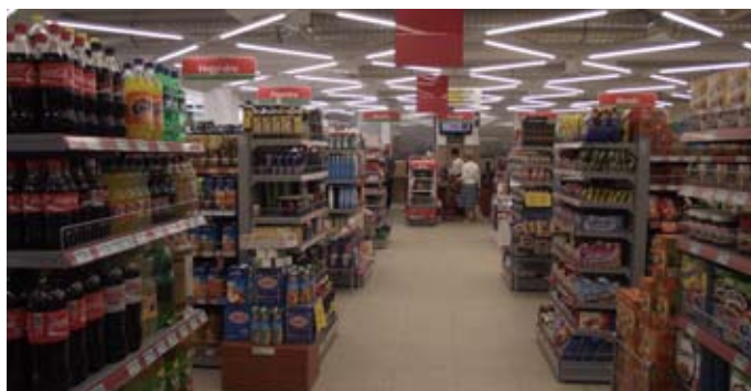
A megújult Kála – kívül és belül