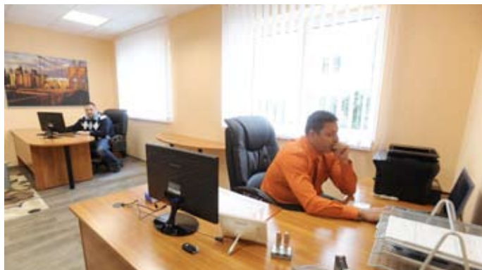
Az első „lakók” megérkeztek.