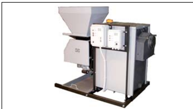
Pelletkazán – versenyre kél a gázkazánal

megkeresés is érkezett a szentesi céghez, főleg pelletértékesítésre kértek árajánlatot.