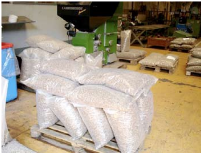
Csomagolják a kész tűzipelletet