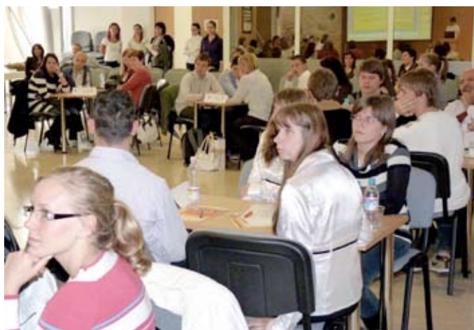
Középiskolások próbálták ki vállalkozói képességüket a kamarában.

A diákok szituációs játékok során mérték össze vállalkozói ötleteiket. A harmadik feladat megoldásában a szervezők által felkért cégek képviselői, mint mentorok is segítettek őket. A középiskolás fiatalok interjúszituációban népszerűsítették vállalkozásaikat, felsorakoztatták a távmunka előnyeit és hátrányait, majd mentoraik segítségével összeállították egy televíziós reklám forgatókönyvét, végül pedig egy gazdasági