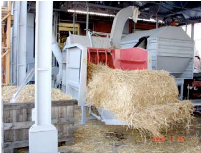
Szalmával etetik a pelletgyártó gépet

A T&T Technik Kft. temesvári üzleti tárgyalásai során a egyik partnerüket maga az agripellet-előállító berendezés érdekelte, telepítéssel és beüzemeléssel együtt. Zajlanak az egyeztetések, pályázati elbírálásra várnak a felek. Három nagyszalontai vállalkozás pedig pelletadagolóval felszerelt kazánra adott megrendelést a szentesi cégnek. Már le is gyártották a berendezéseket, csak a szállítás van hátra. Ezek az üzletek hosszú távon is ígéretesek, ugyanis a három kazán folyamatos pelletellátását is a szentesiek fogják biztosítani. A létesítendő üzem alkatrészellátásából és szervizeléséből szintén hosszú távú kapcsolatot remélnek. A kiállítási standon tapasztalt érdeklődésnek, szórólapoknak, hirdetési kapcsolatnak köszönhetően több más