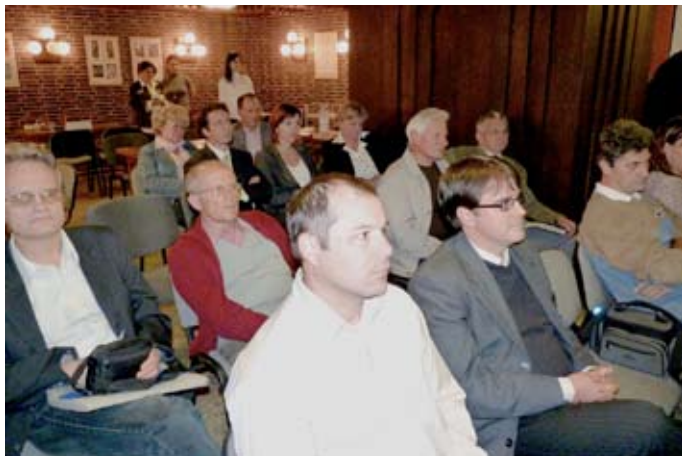
Szegeden a Somogyi-könyvtár adott otthont a rendezvénynek

zódhattak az üzleti partnerkeresési lehetőségekről és a kamarában elérhető finanszírozási lehetőségekről. A roadshow a szegedi és a hódmezővásárhelyi állomás után Szentesre, Makóra, majd Csongrádra látogatott. A programsorozatnak minden városban a helyi könyvtárak adtak otthont.